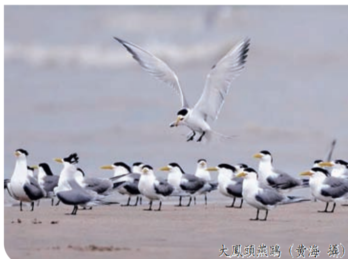
大鳳頭燕鷗