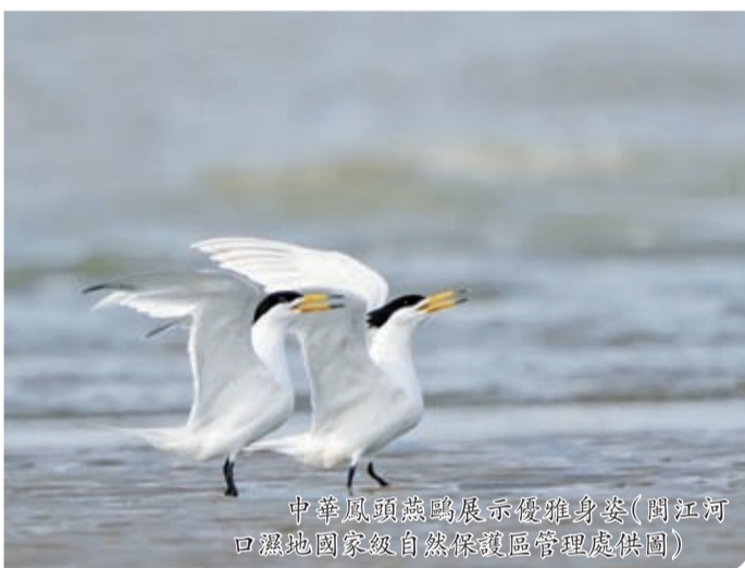
中華鳳頭燕鷗展示優雅身姿(閩江河口濕地國家級自然保護區管理處供圖)