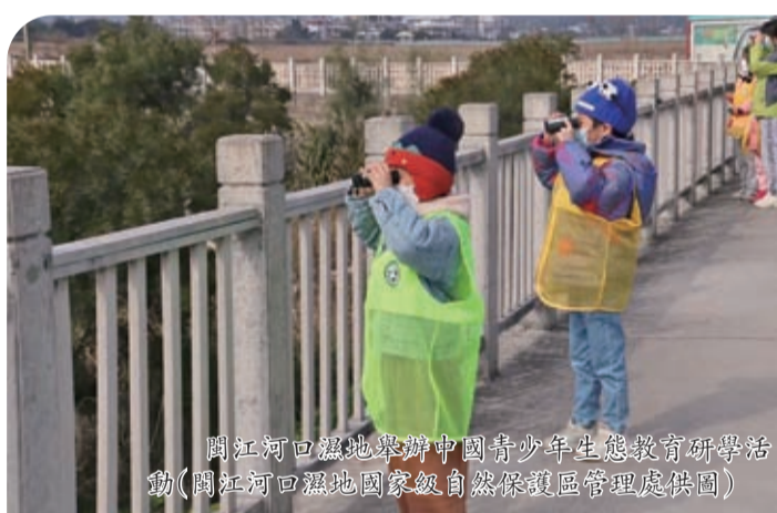
閩江河口濕地舉辦中國青少年生態教育研學活動